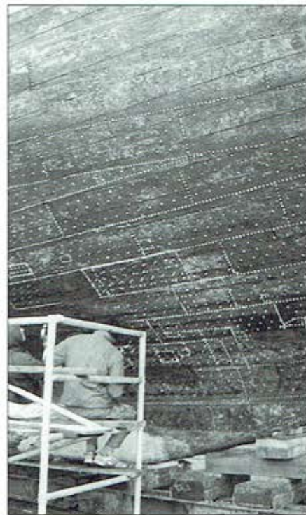
De teakhouten romp was geheel voorzien van koperen platen. Nadat alles was verwijderd moesten er 55.000 spijker-gaatjes worden afgepropt. De huid was, op een gang na, in prima conditie.

Van Grinsven had al wat ervaring in het zeilen met gasten op de Middellandse Zee. Hij wilde verder weg en toen hij twee jaar geleden zijn bedrijf kon